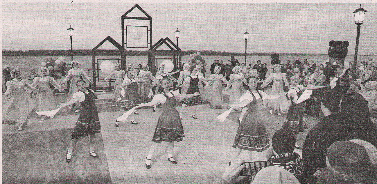
• Объект «Набережная» был открыт в Каргаске в 2023 году.

В Томской области, как и по всей стране, стартовало голосование, в ходе которого предстоит выбрать территории для проведения благоустроительных работ в следующем 2026 году по национальному проекту «Инфраструктура для жизни». Продлится оно с 21 апреля по 12 июня.