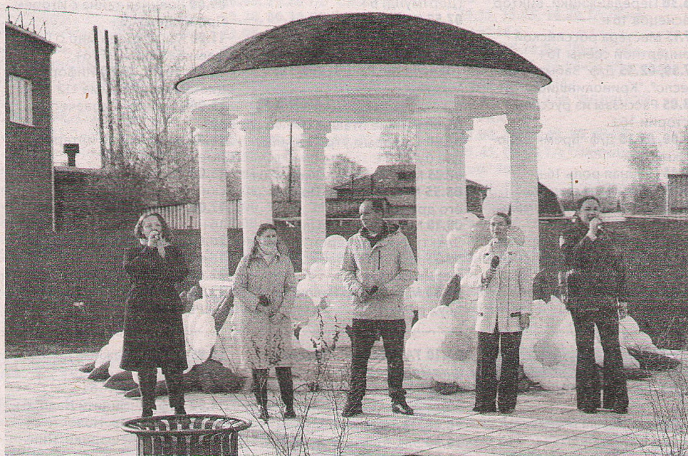
• Подарком для всех каргасокцев в Год семьи стал сквер семьи, любви и верности.